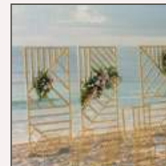
DECORACIÓN FLORAL PARA LA ESTRUCTURA DE LA CEREMONIA