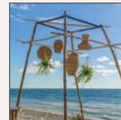
DECORACIÓN FLORAL PARA LA ESTRUCTURA DE LA CEREMONIA