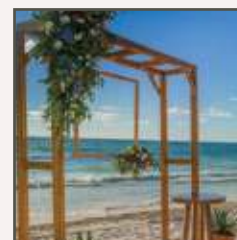
DECORACIÓN FLORAL PARA LA ESTRUCTURA DE LA CEREMONIA