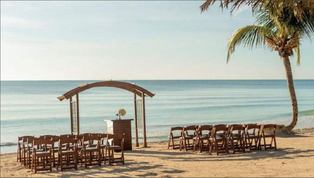
MONTAJE DE PLAYA COMPLEMENTARIO