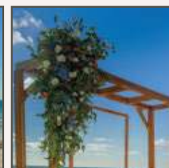
DECORACIÓN DEL PASILLO