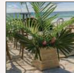
DECORACIÓN DEL PASILLO