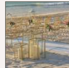
DECORACIÓN DEL PASILLO